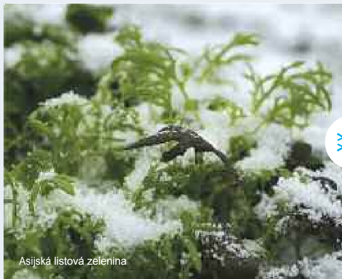
Asijská listová zelenina