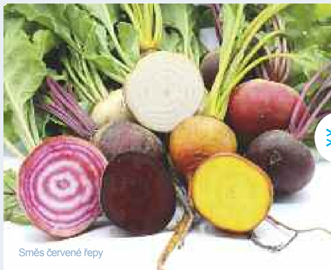
Směs červené řepy