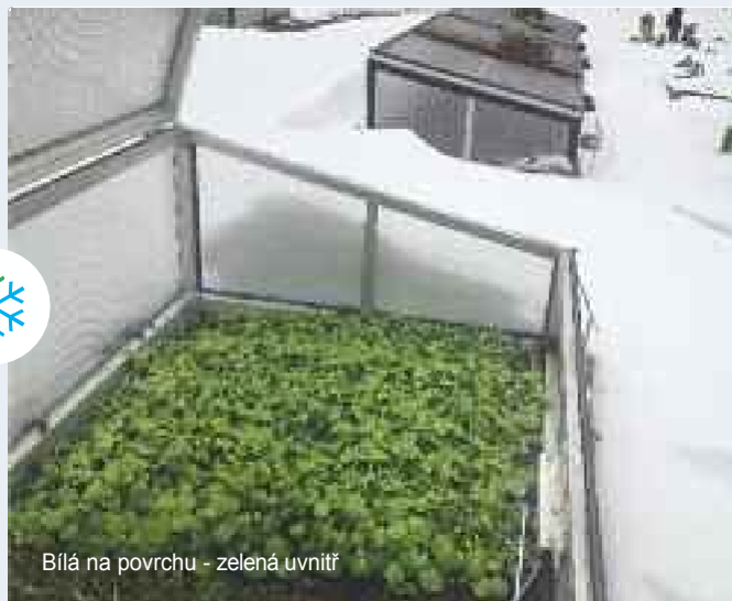
Bílá na povrchu - zelená uvnitř